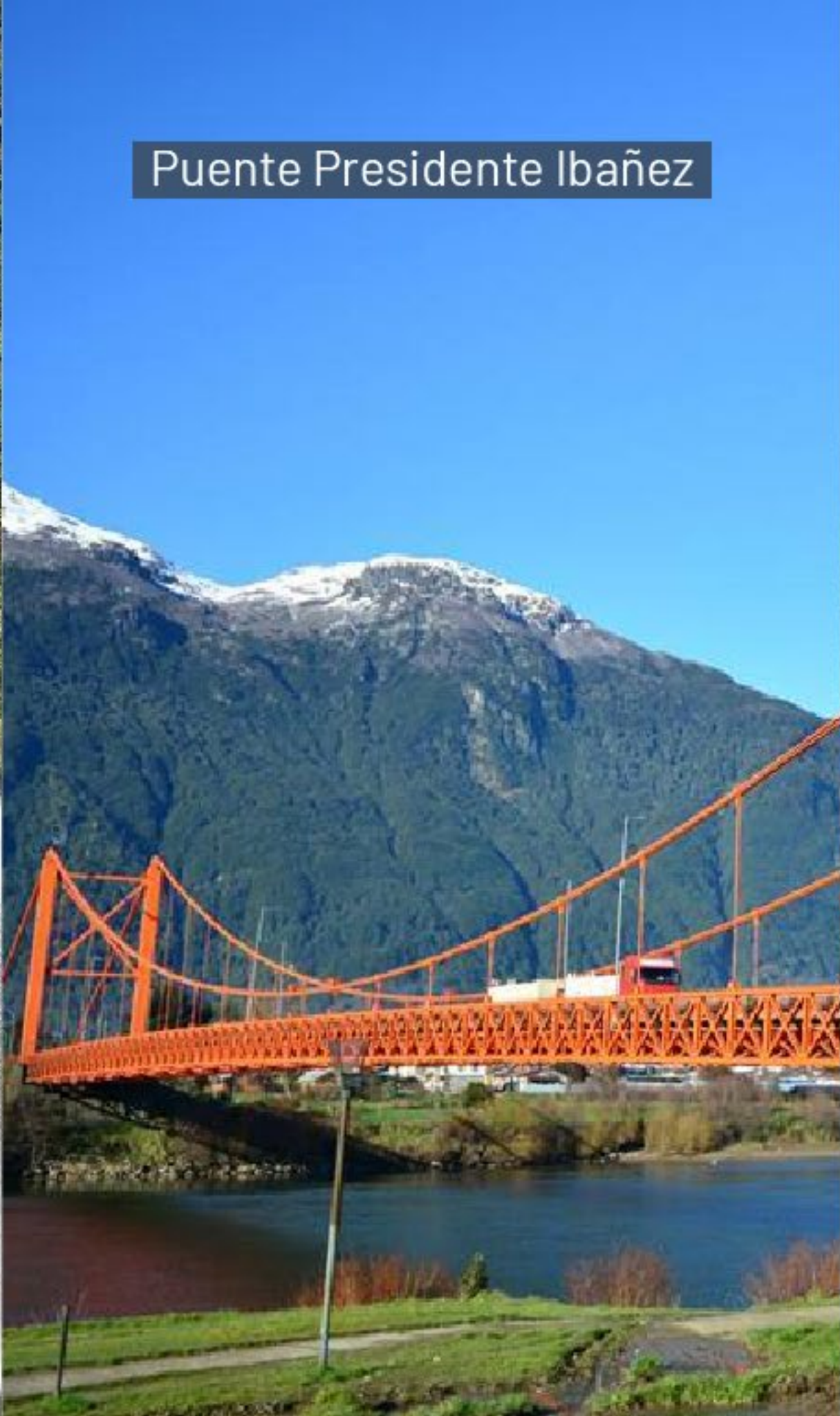
Puente Presidente Ibañez